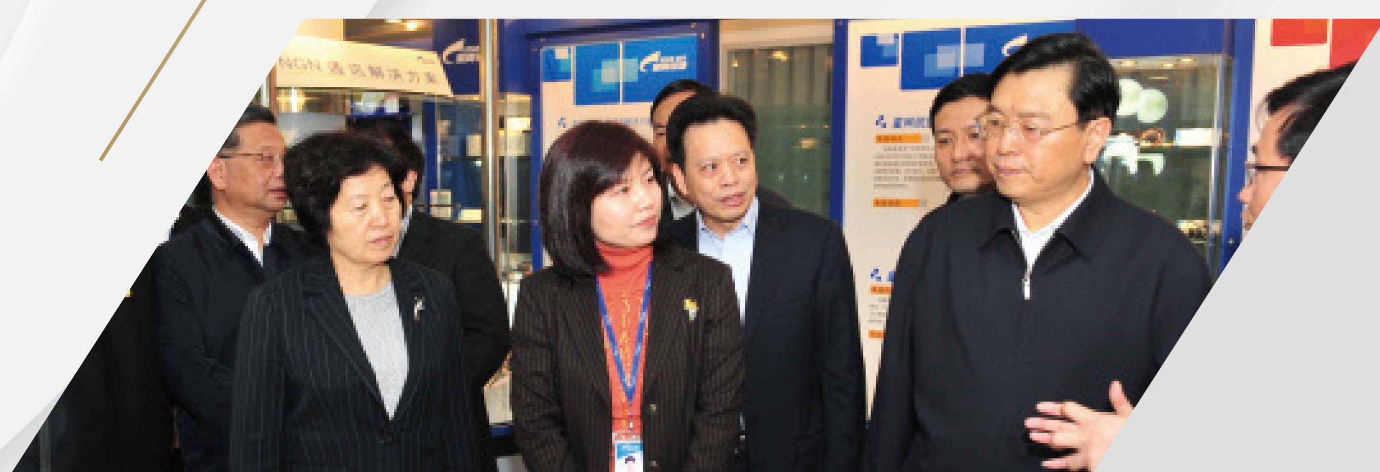
张德江 全国人大常委会委员长

多位历任党和国家领导人先后莅临锐捷网络参观考察， 赞扬锐捷在自主创新道路上的付出与收获， 通过自主创新赢得实力、赢得领先。