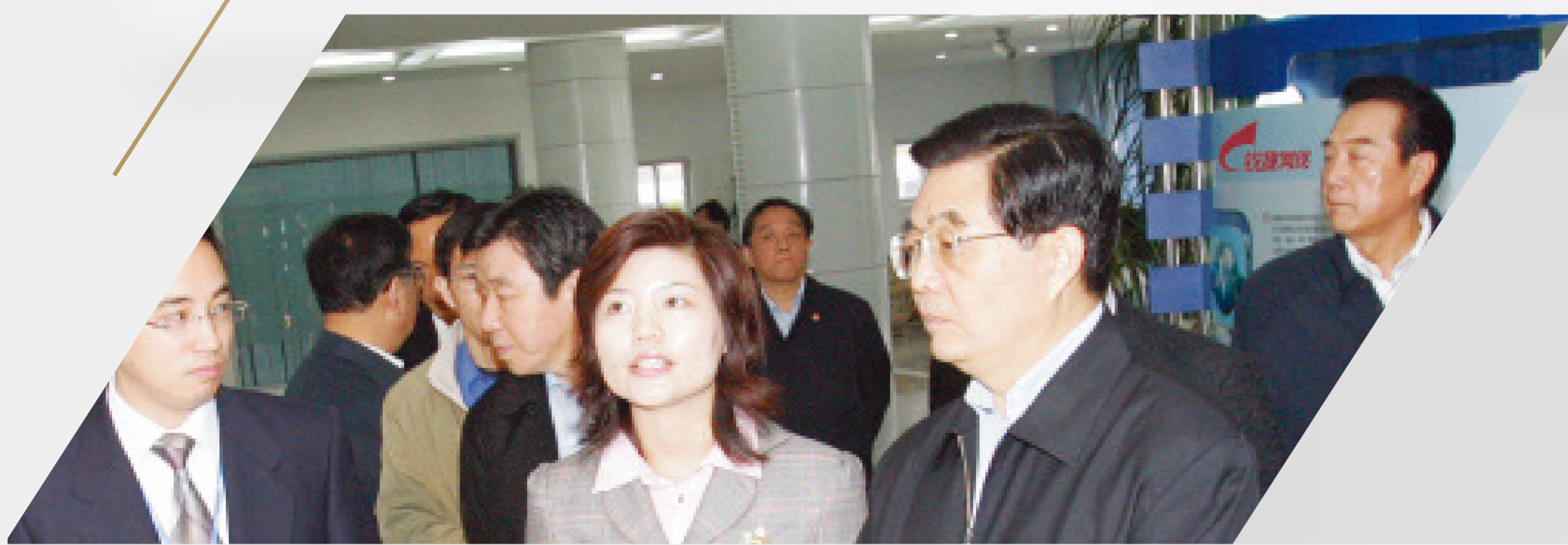
胡锦涛 时任国家主席