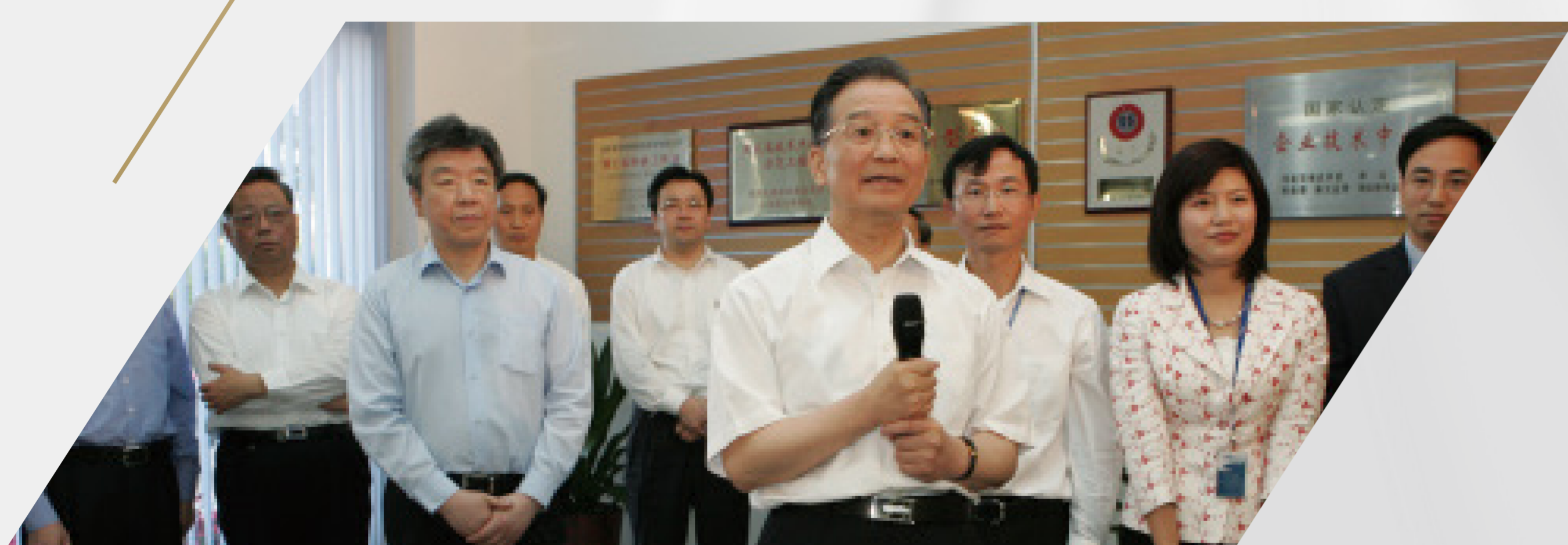
温家宝 时任国务院总理