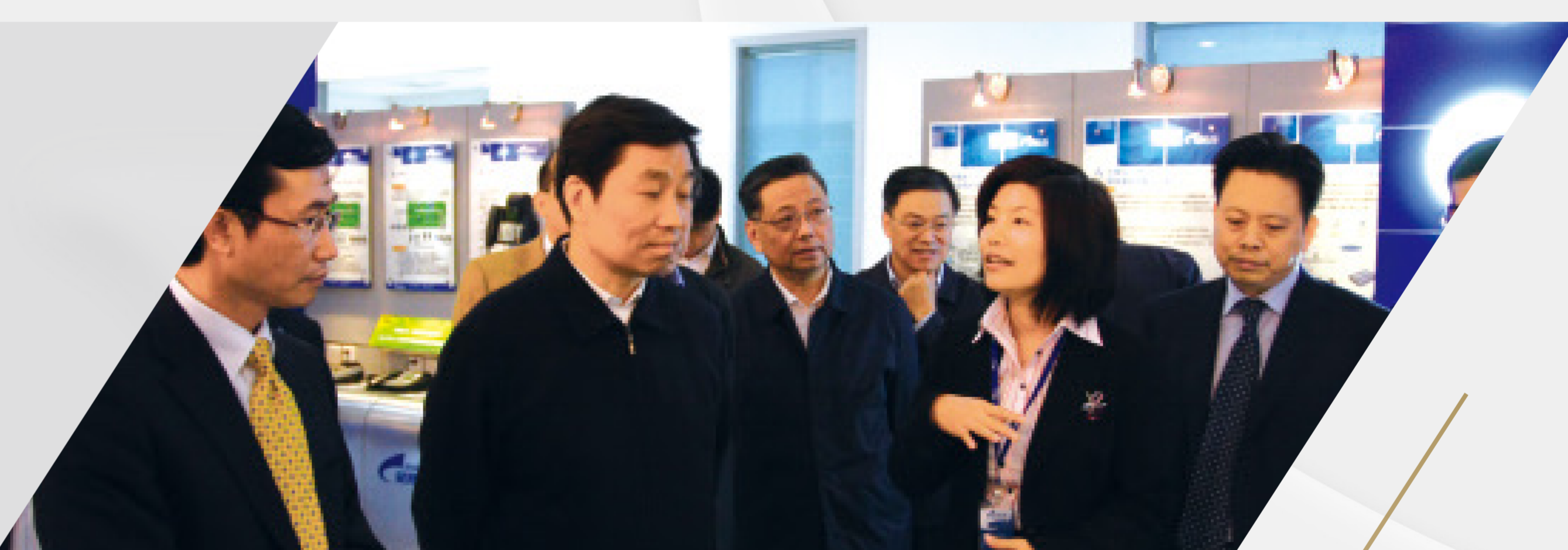
李源潮 国家副主席