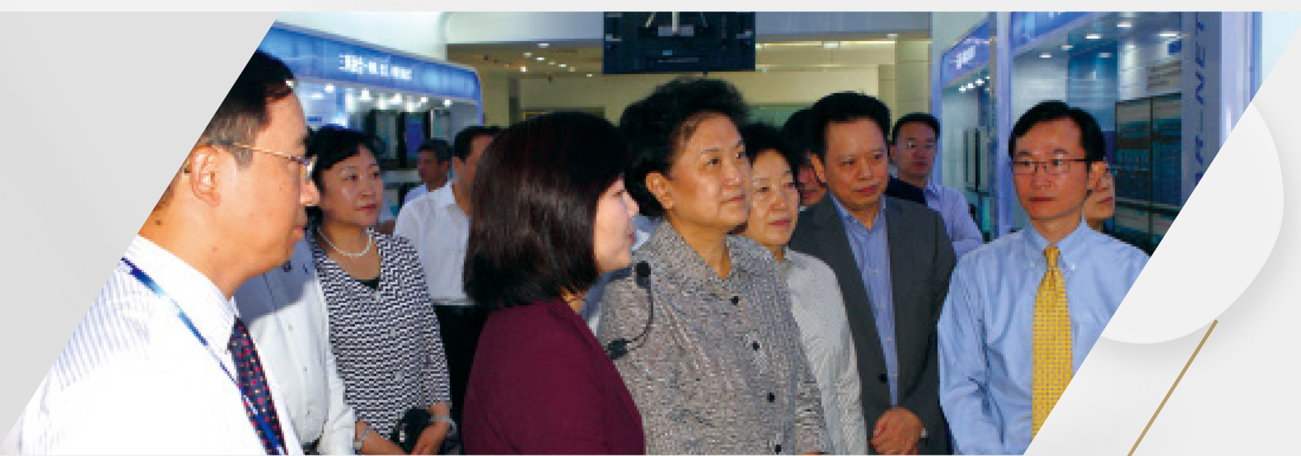
刘延东 国务院副总理