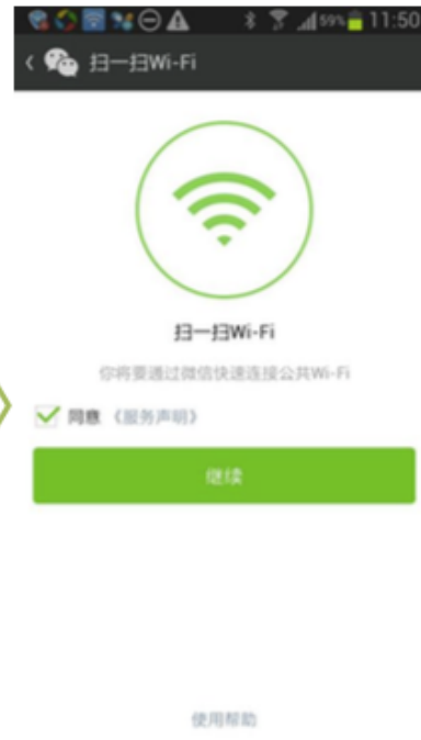
第一次需同意协议